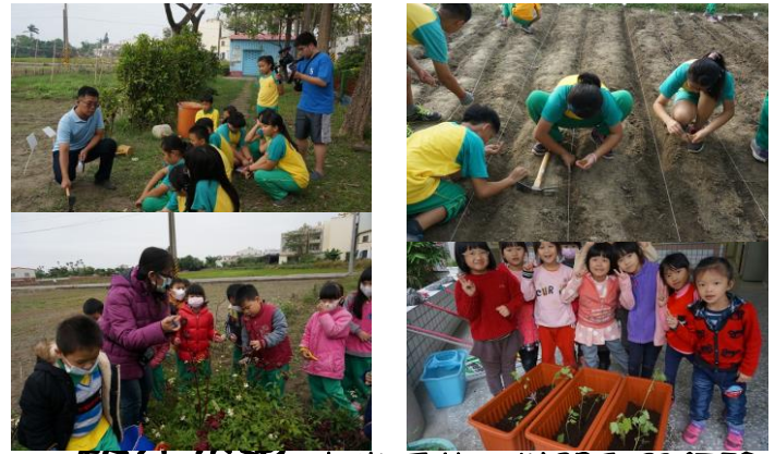
走出戶外，狀況學習經驗

學校努力爭取申請計畫補助帶領學生到校外進行生態體驗，地點有：走馬瀨農場、海生館、科博館等地