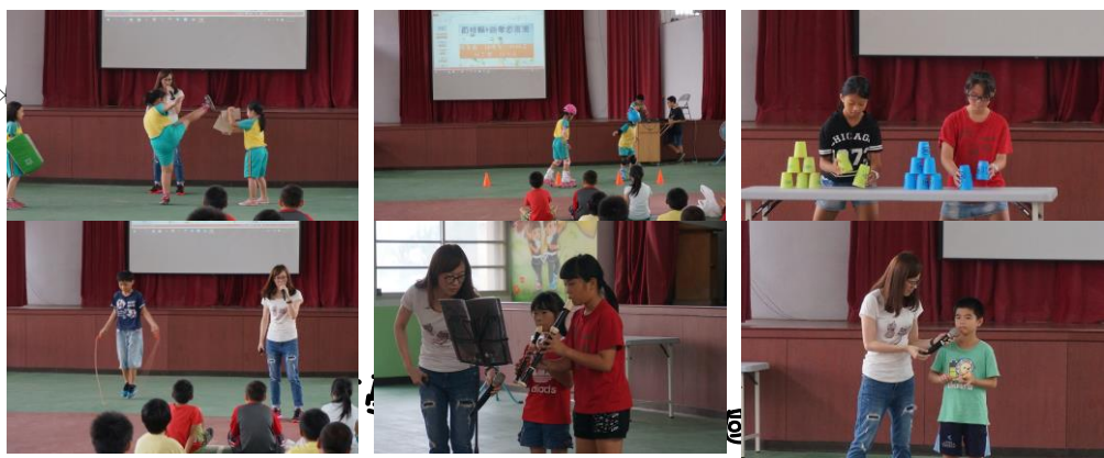
每週五進行英語每週一句及母語教學