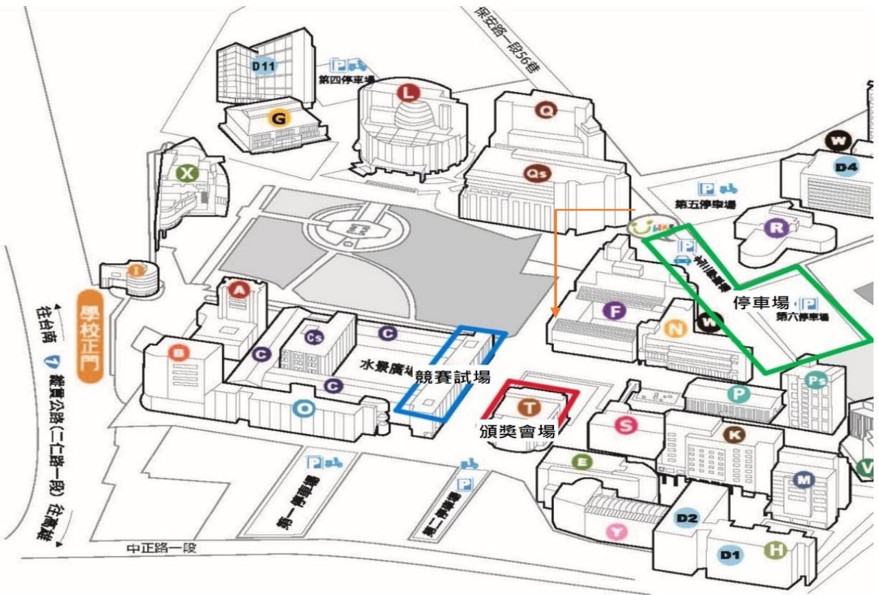
圖1、活動會場動線圖