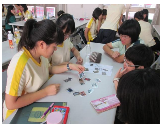
居家生活能源總體檢-電器耗能比一比