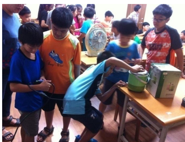
能源總體檢-電器設備檢測