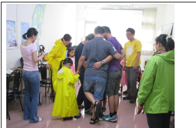
地球暖烘烘體驗活動