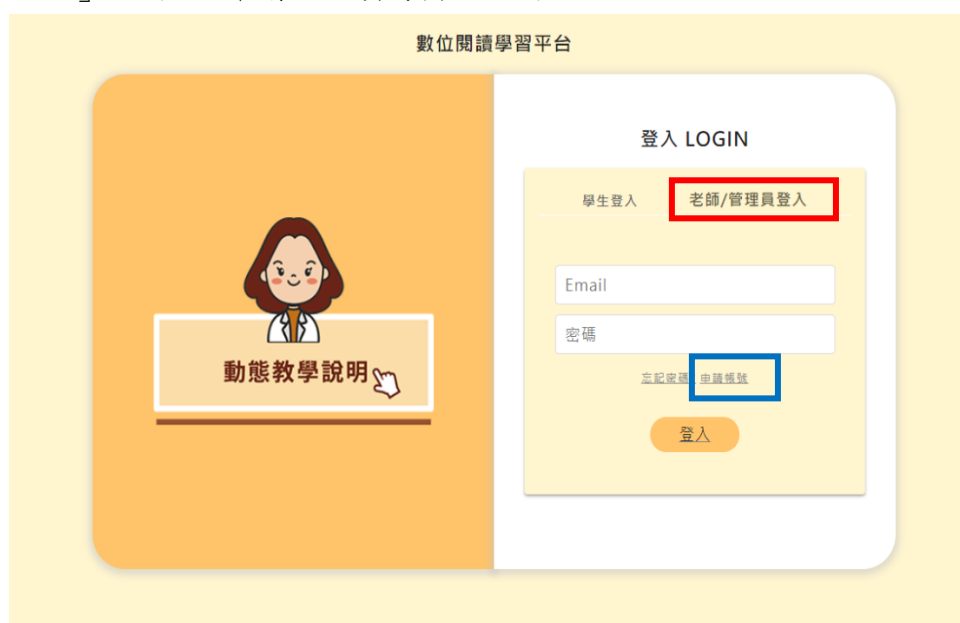
圖 1：數位閱讀平台首頁