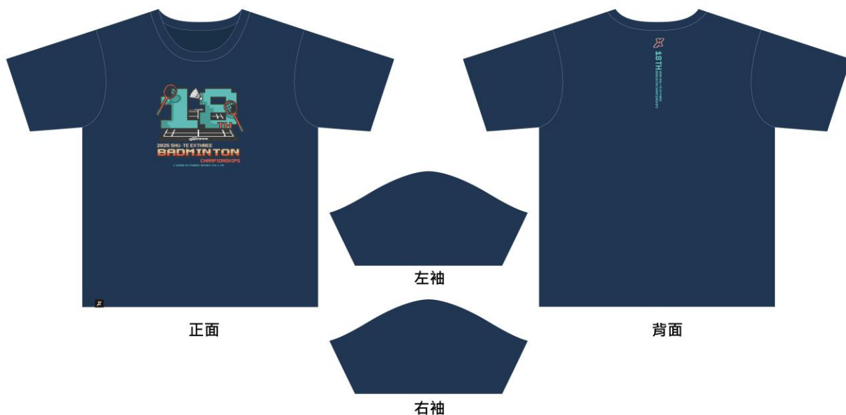
熱昇華 T-Shirt 尺寸表