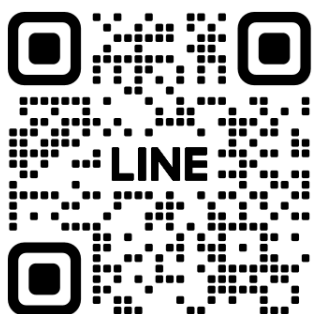
官方 LINE QRcode

IG (網址： https://www.instagram.com/aaker.pe/ )