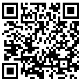
↑ 報名網站 QR code ↓