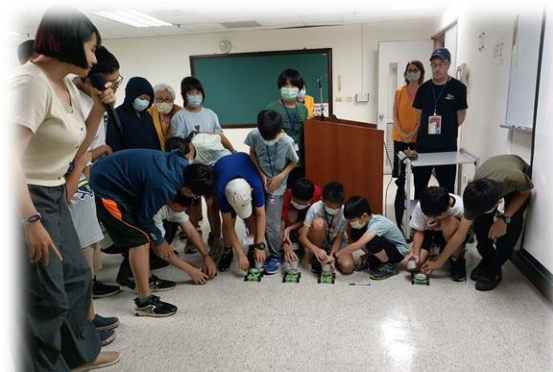
▲科學觀察專注力培養