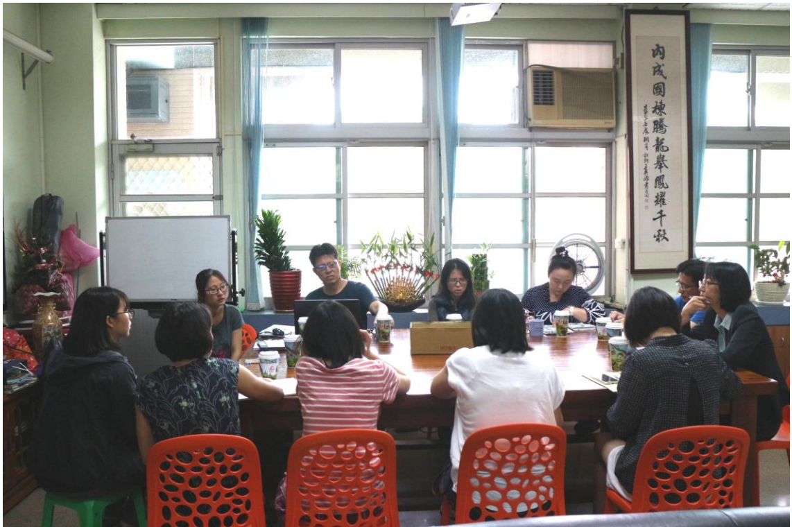
照片說明：交通委員正在討論本學期翰生安親班路隊動線及雨天家長接送情況。