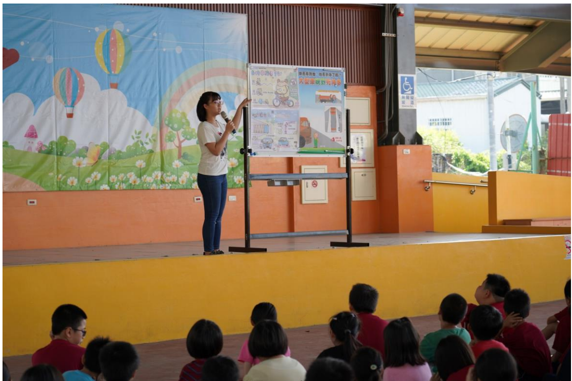
照片說明：生教組長利用週二大放學時間，各放學路隊行進順序晴天雨天路隊行進方向講解與位置調整。