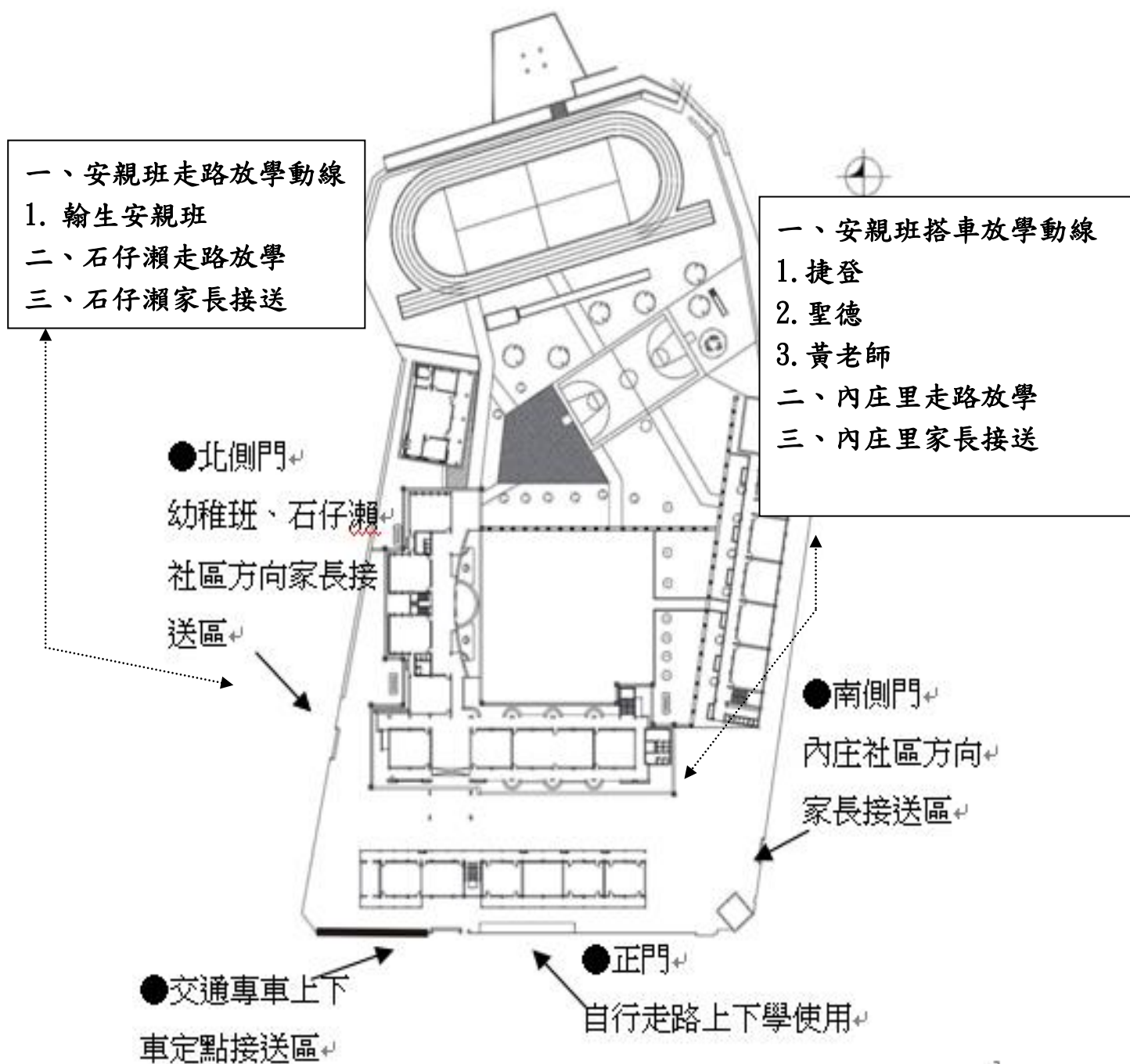
臺南市大內國小 107 學年度交通安全上、放學交通動線規劃表

備註：1.上學時間為上午 7:10-7:30，放學時間為下午 3:50-4:00