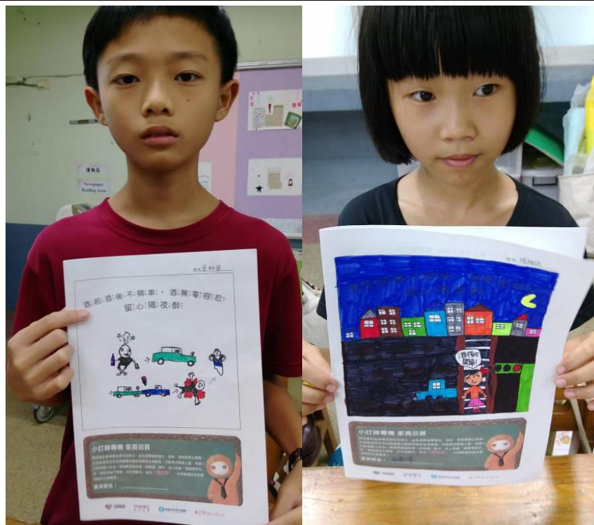
照片說明：學生秀出精彩的「反酒駕」海報設計。