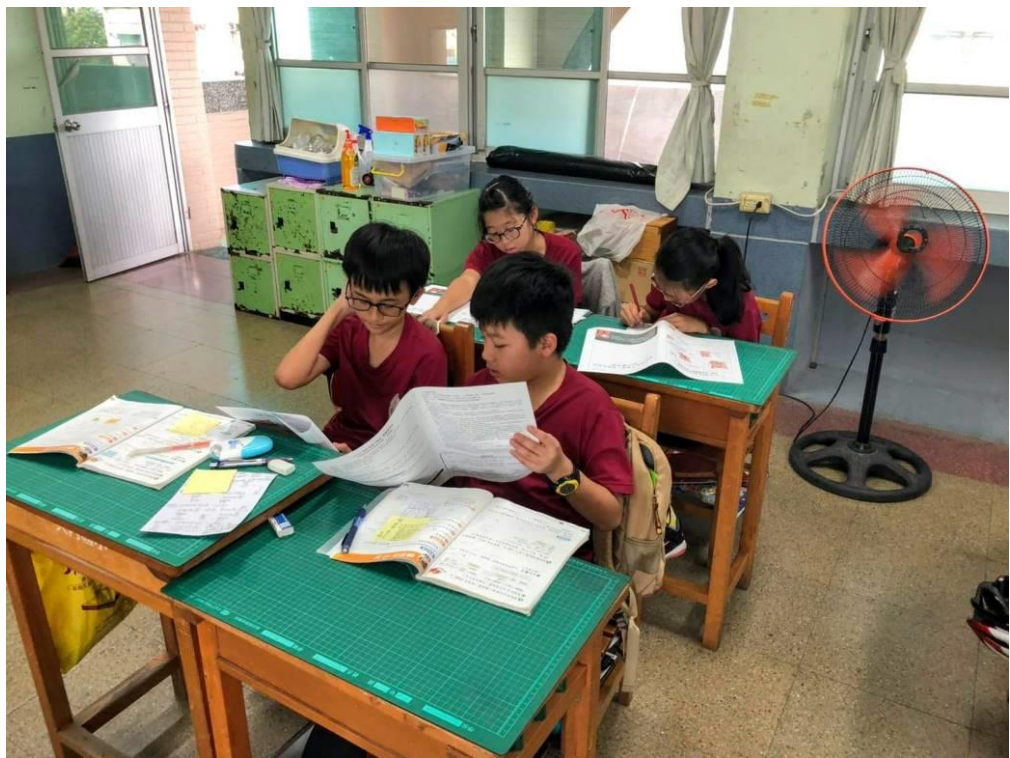
照片說明：請學生討論何謂「隔夜醉」、酒駕之後果。