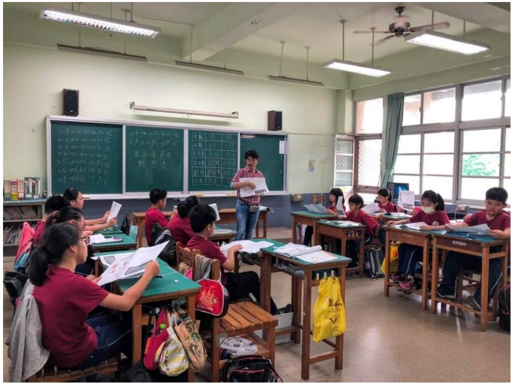
照片說明：導師將交通安全融入課堂，向解說該大作之意義、內容，並做交通安全教學。