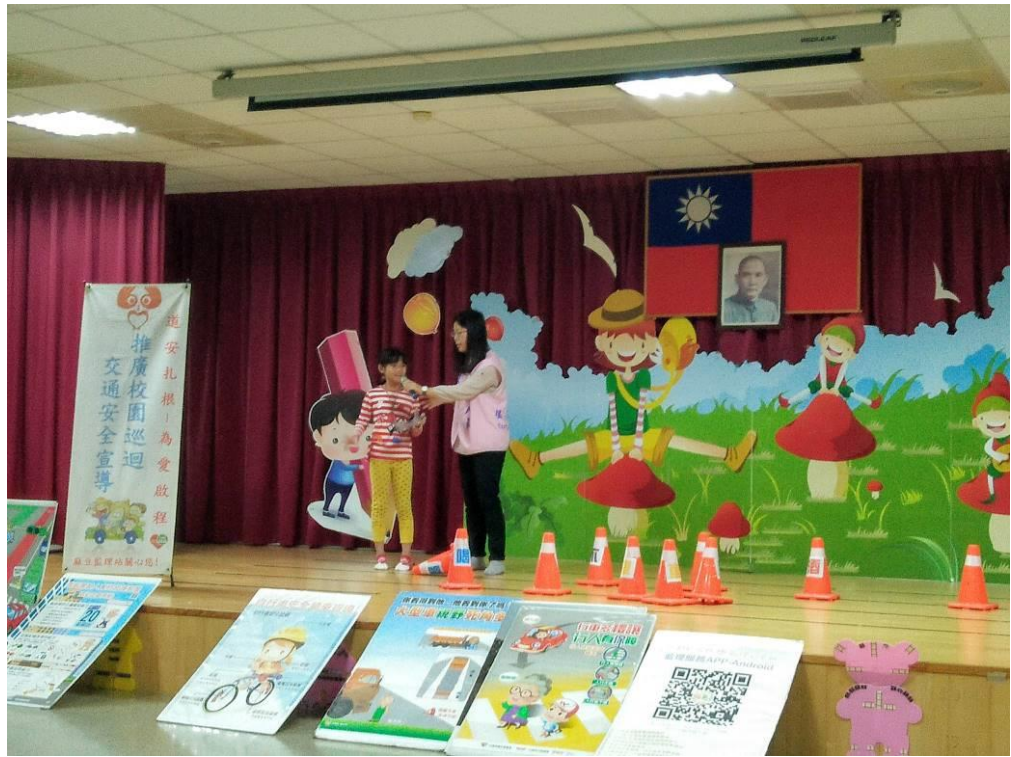
照片說明：邀請學生蒙眼體驗酒駕的情形，並加強「反酒駕」宣導。