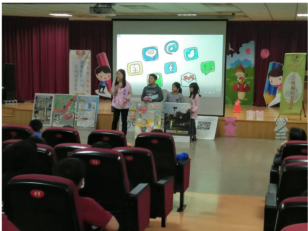
照片說明：請答對的學生上台領獎。