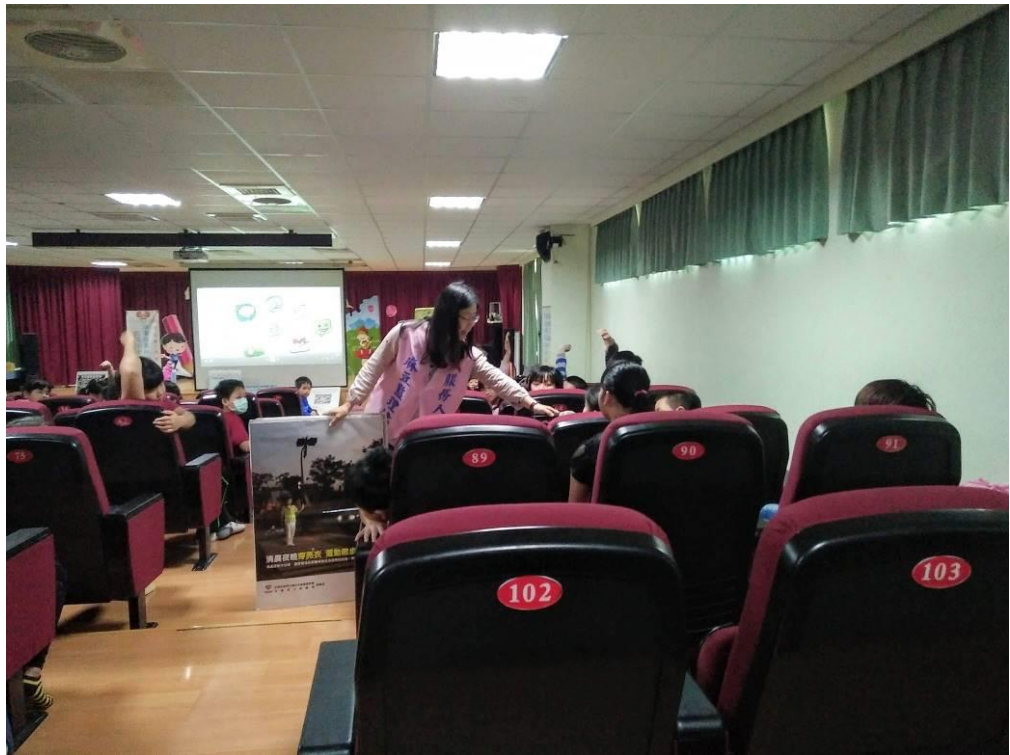
照片說明：針對老年人於早晚過馬路注意事項，進行有獎徵答。