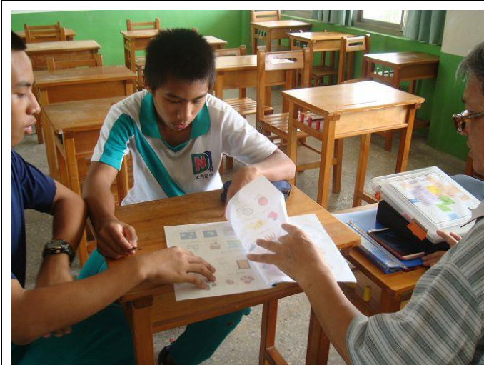
活動照片 1、2：上課情況