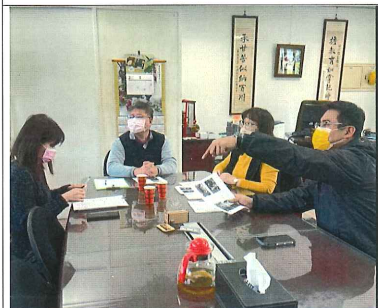
里長確認樹木移除及修剪的規畫情形