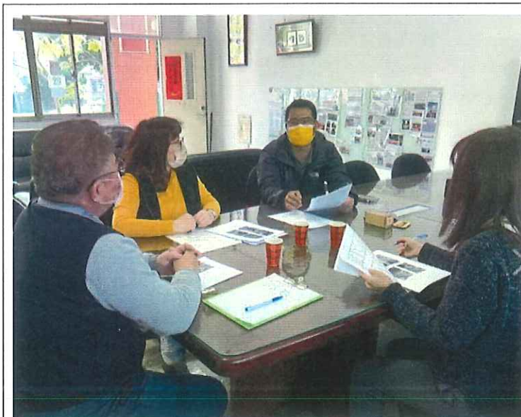
邀請社區里長參加說明會