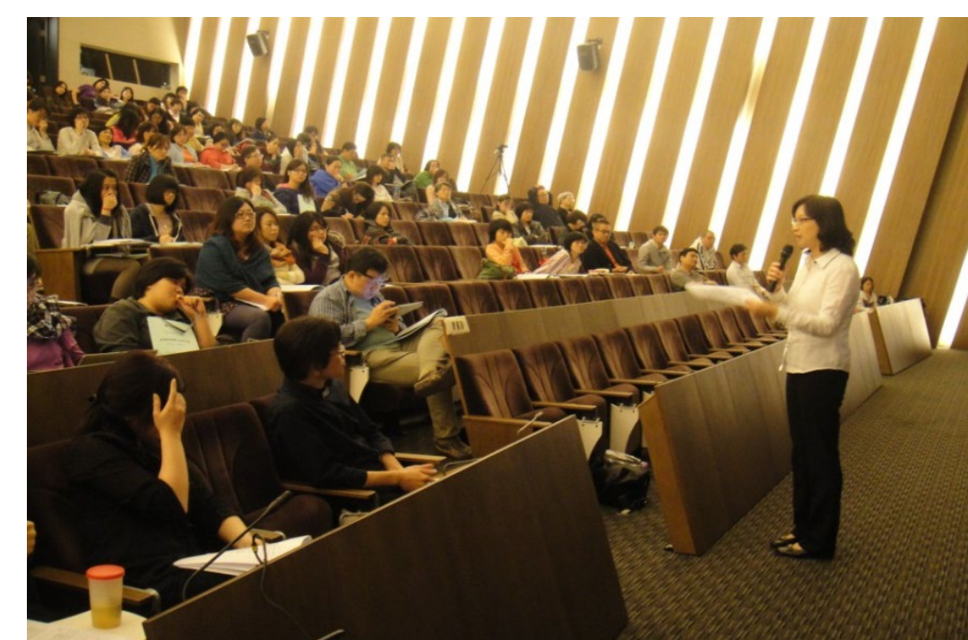
心理聯合年會-研討會