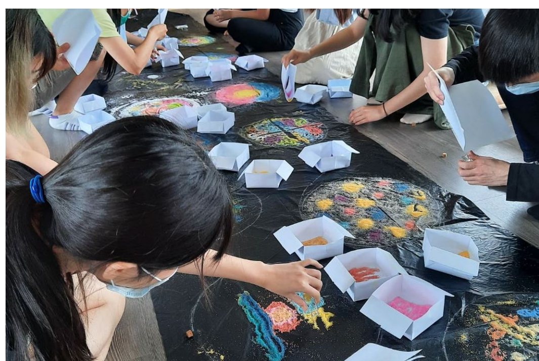
弱勢家庭生命劇場工作坊

選修科目： 諮商與心理治療技術、團體諮商與心理治療、家族治療實務、青少年與戲劇治療、伴侶與婚姻諮商、變態心理學、心理衡鑑、進階統計學、質性研究、諮商專題研究、專業實習(一)(二)、後現代家族治療與實務、生涯諮商與輔導、兒童與家庭發展專題研究等