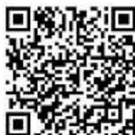
認識篇 了解何謂學習歷程