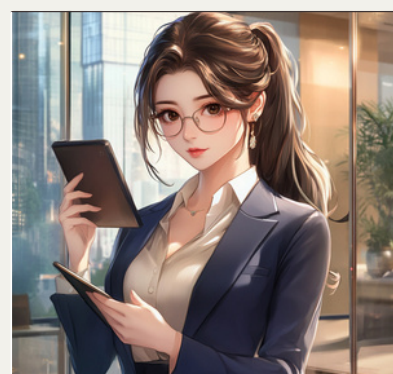
目標導向的進修者