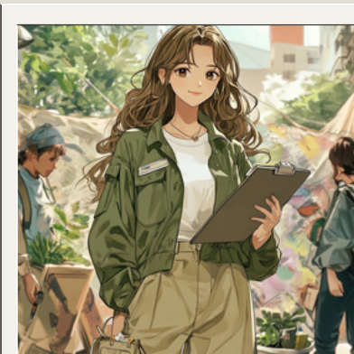
改變世界的理想家