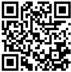
國立空中大學推廣教育中心 網站 QR Code