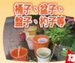
桶子、盆子、盤子、杓子等