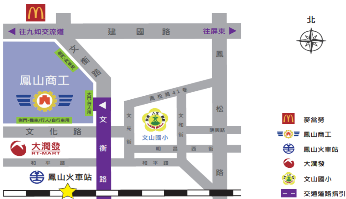
國立鳳山高級商工職業學校 交通位置示意圖