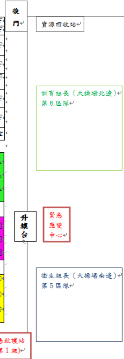
臺南市立大灣高中自衛消防編組配置圖