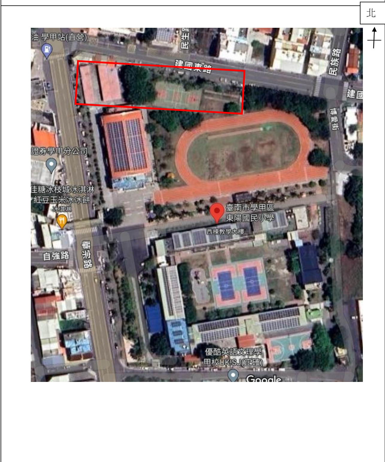
規劃設置基地空拍圖(光電風雨球場、光電汽車停車棚、光電機車停車棚)