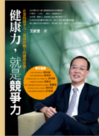
身心平衡 健康才是最大的資本