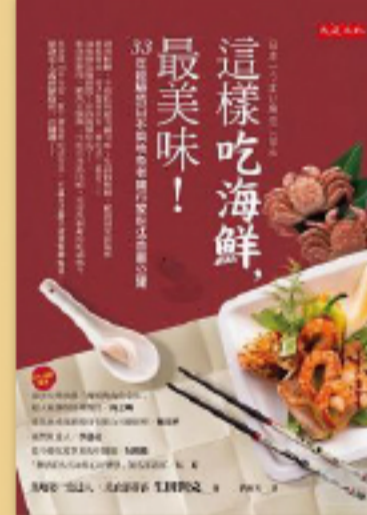
理想生活 快樂生活也是富足