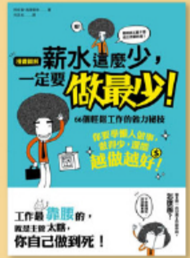
效率工作 工作力就是賺錢力