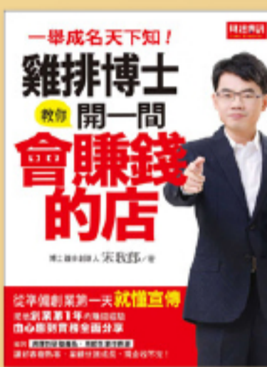
創業經營 自己當老闆，薪水放口袋