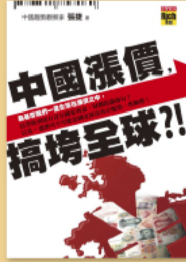
經濟趨勢 世界大事如何影響我的荷包？