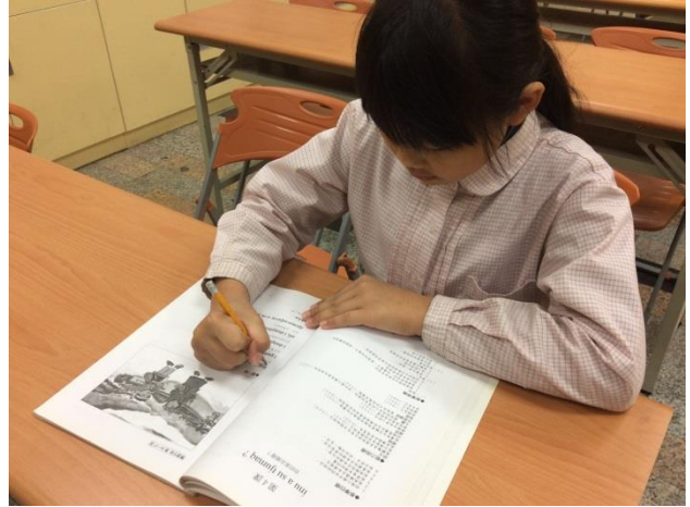
活動照片 2：練習拼音