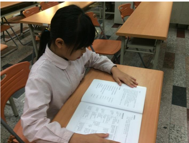
活動照片 3：認真研讀課文