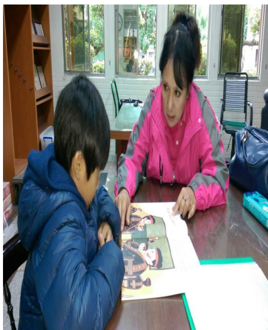
活動照片 9：上課內容:第一階 1-5 課