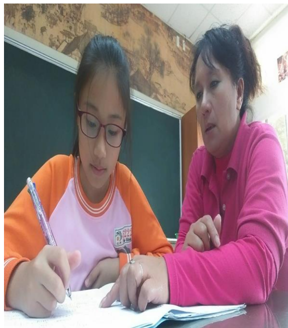
活動照片 2：聽力測驗