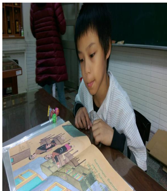
活動照片 6：上課內容:第一階 5-10 課