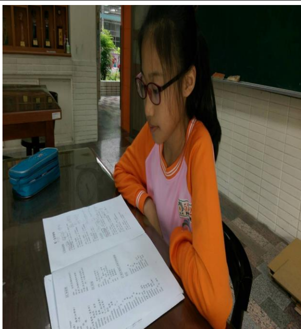
活動照片 7：上課內容:第三階 1-5 課