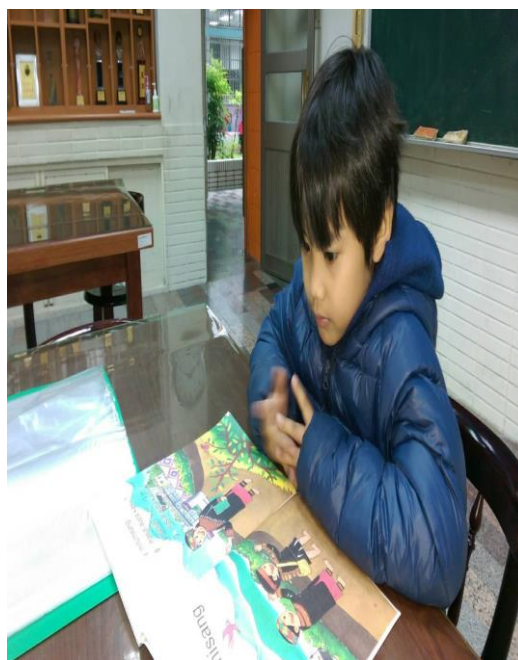
活動照片 10：上課內容:第一階 5-10 課