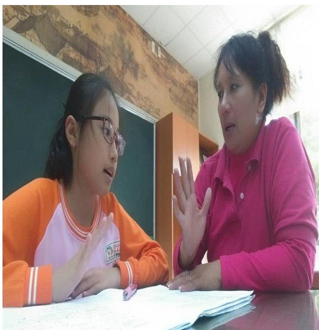
活動照片 11：上課內容:第三階 1-5 課