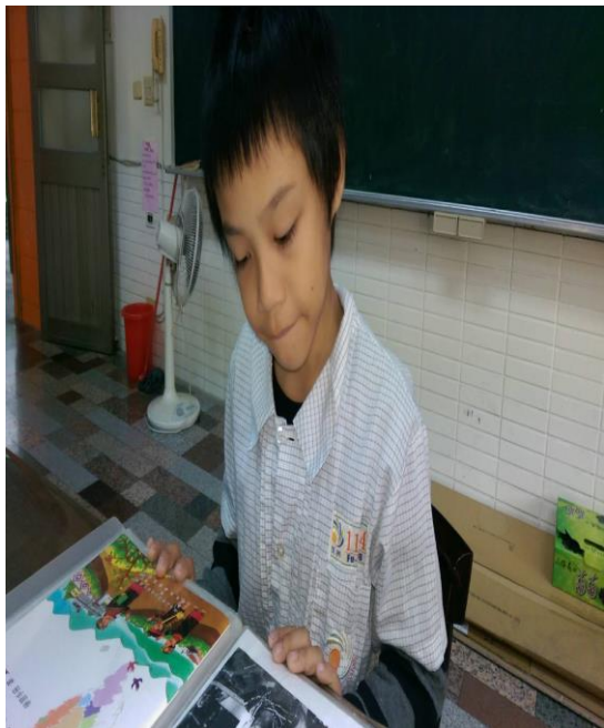
活動照片 1：課文詞彙