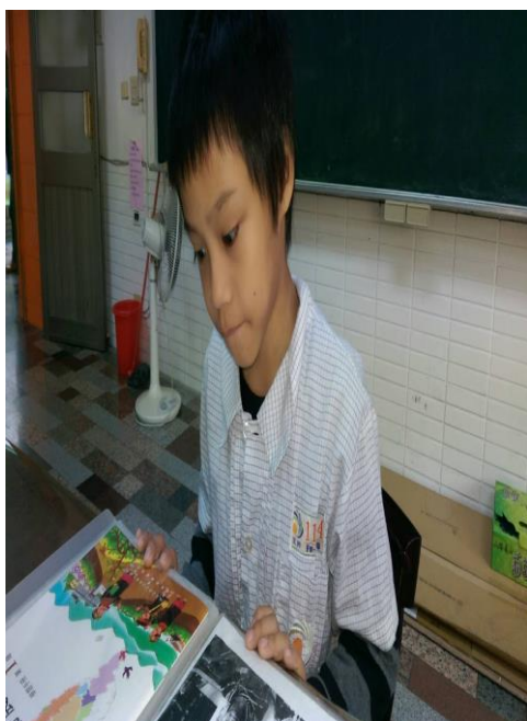
活動照片 5：上課內容:第一階 1-5 課