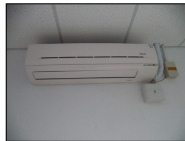
圖 5、汰換老舊高耗能窗型冷氣為分離式冷氣，並導入能資源智慧管理系統，搭配課表控制、卸載管控及停機排程功能