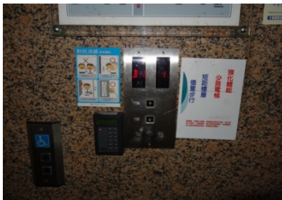
張貼節約能源標語(1)