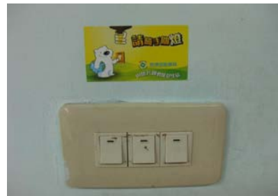
張貼節約能源標語(2)

備註：其他節約能源相關作法可參考「政府機關及學校節約能源行動計畫」( https://egov.ftis.org.tw/download?cno=2 )。