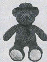
Ollie 歐理露營熊 (身高35公分)