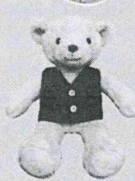
Omie 歐米露營熊 (身高35公分)