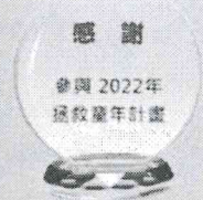
感謝水晶座 (刻印捐款人大名)