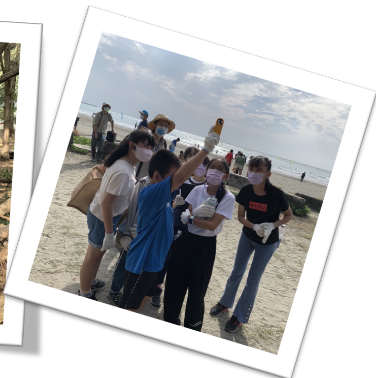
◇ 成為海岸森林的調查員