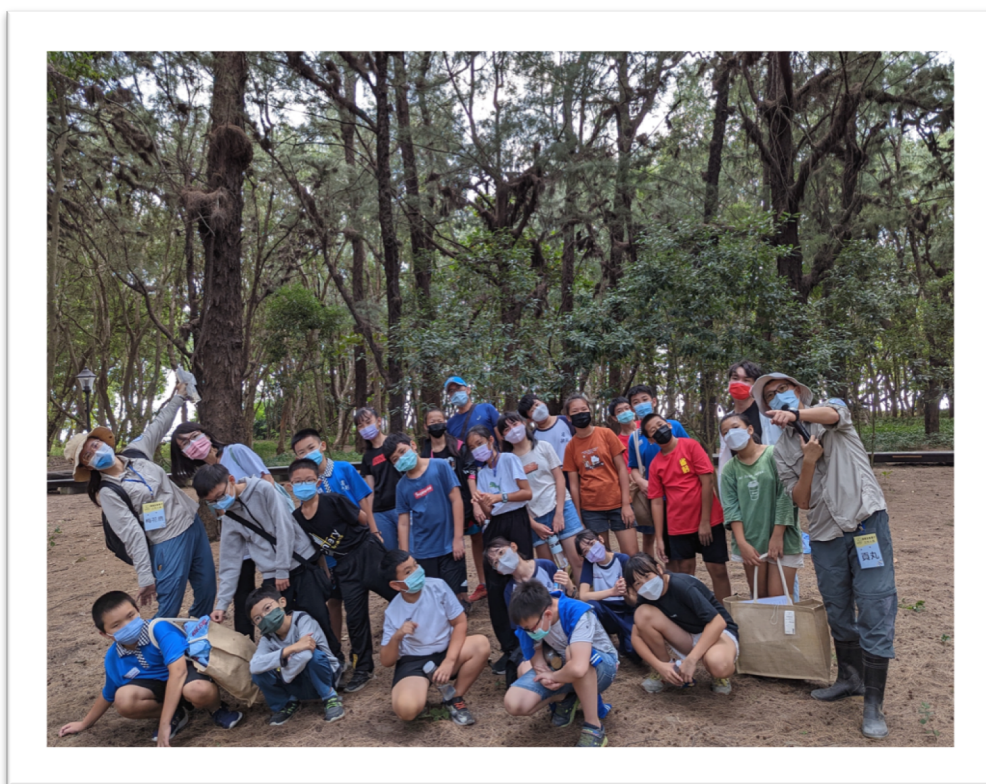
◇ 一起來認識這片守護我們的海岸森林吧！