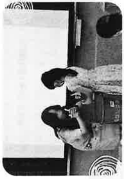
志工帶領小朋友練習 摺抹布的技巧