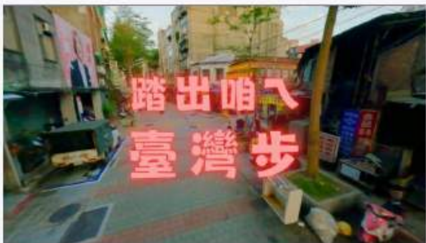
《踏出咱ㄟ臺灣步》完整版MV下載