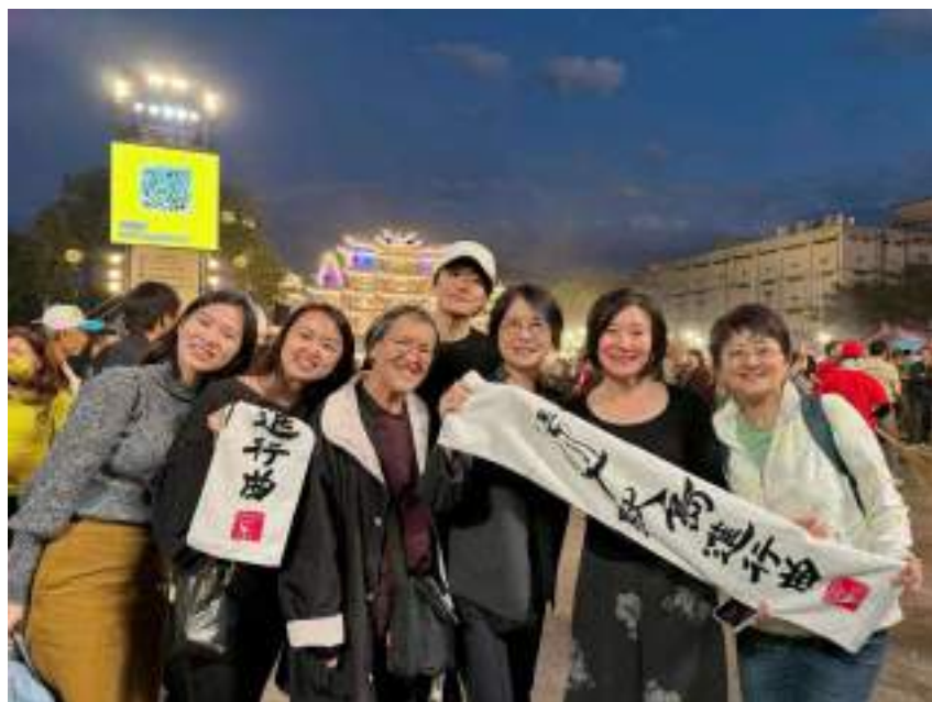
提供參與者限量紀念禮品