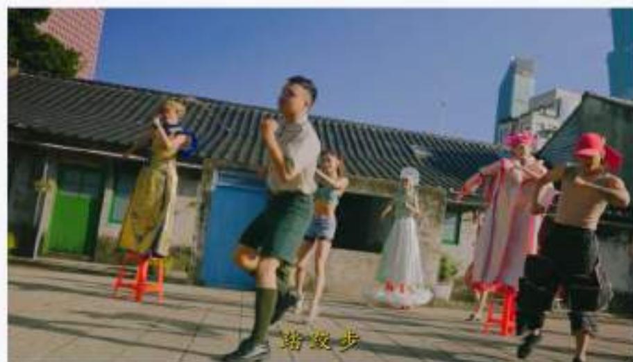
《踏出咱ㄟ臺灣步》教學版下載