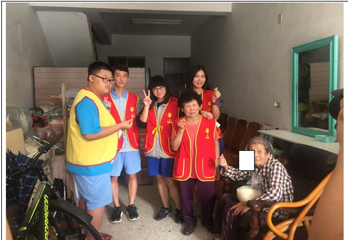
愛心社學生參與關懷社區獨居老人活動