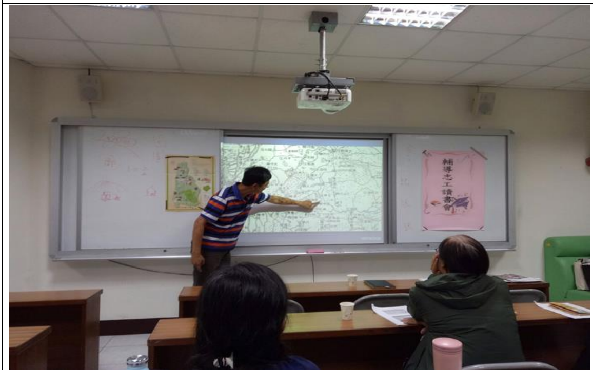
家長志工成長讀書會-歸仁文史探索