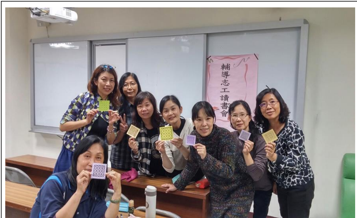
家長志工讀書會-纏繞畫製作