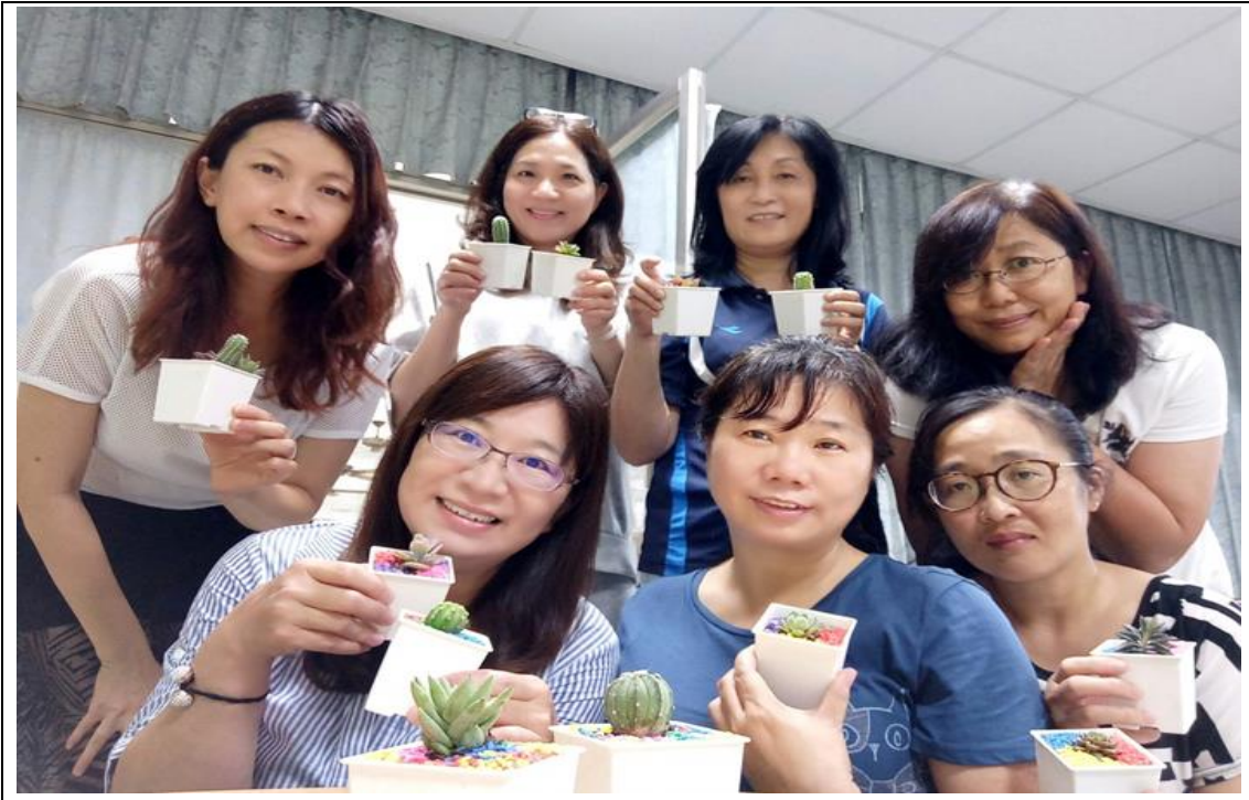
家長志工成長讀書會-園藝實作