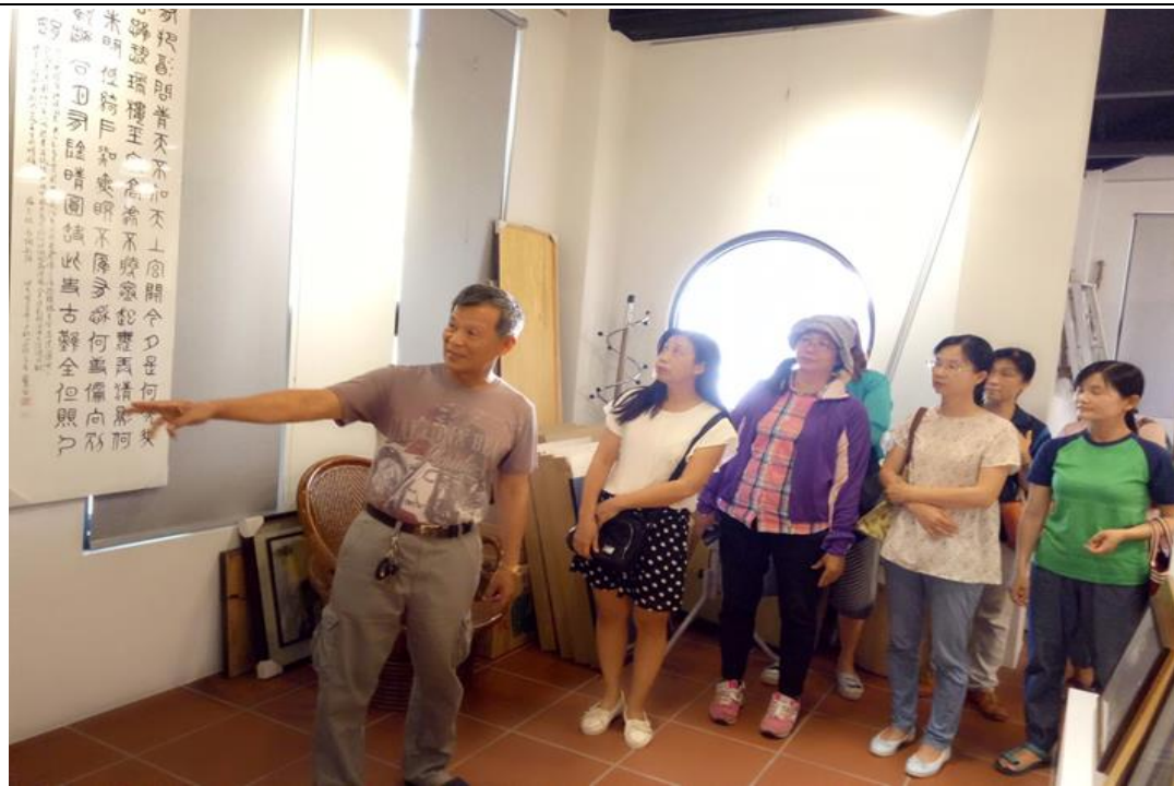
家長志工成長讀書會-書法賞析