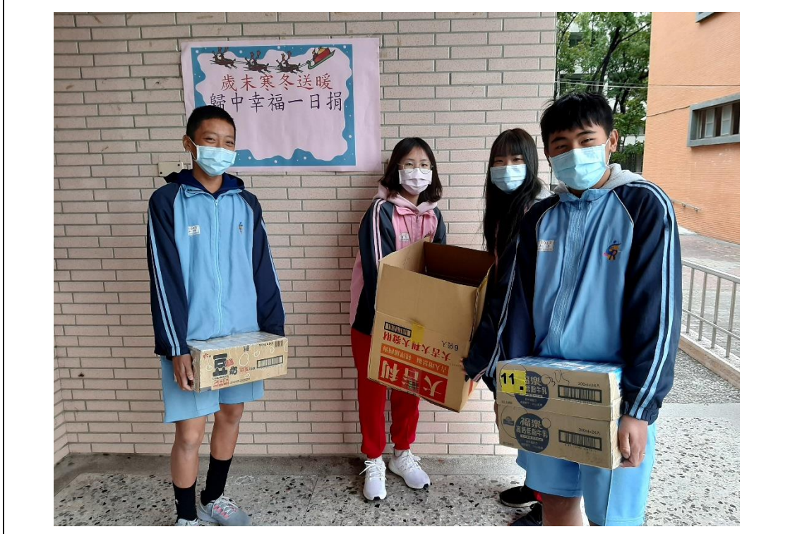
寒冬送暖-校內募集愛心物資送給社區弱勢家庭