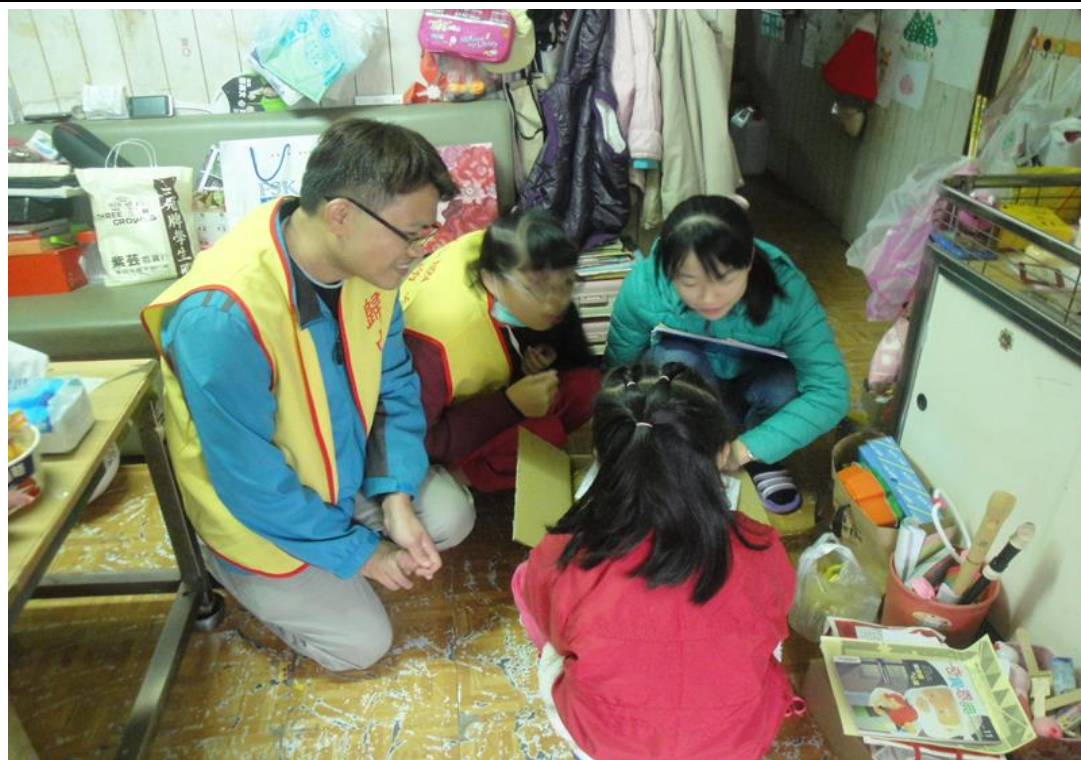
寒冬送暖-校內募集愛心物資送給社區弱勢家庭