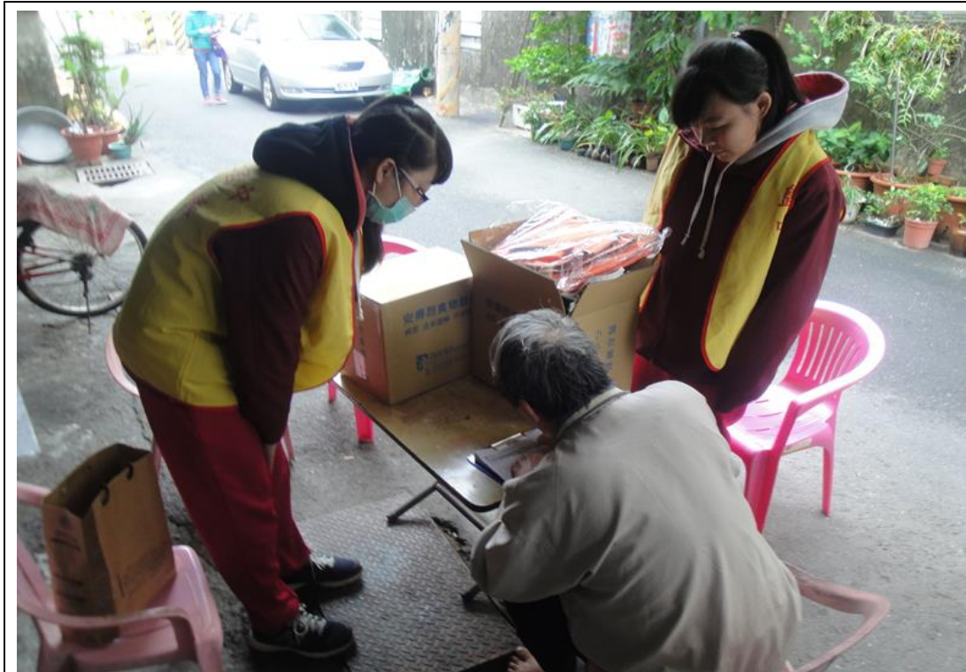
寒冬送暖-校內募集愛心物資送給社區弱勢家庭