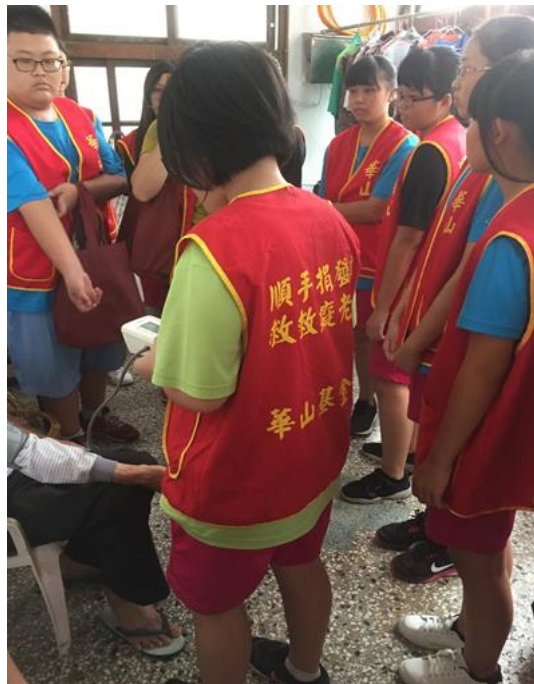
愛心社學生參與關懷社區獨居老人活動