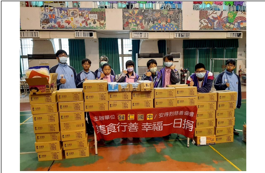
寒冬送暖-校內募集愛心物資送給社區弱勢家庭