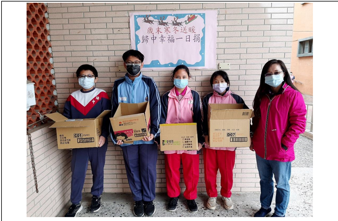
寒冬送暖-校內募集愛心物資送給社區弱勢家庭