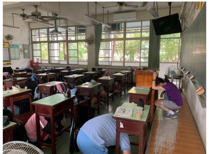
師生趴下、掩護、穩住