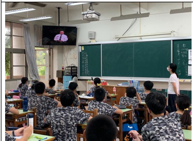
火災影片-破解火場逃生三個迷思