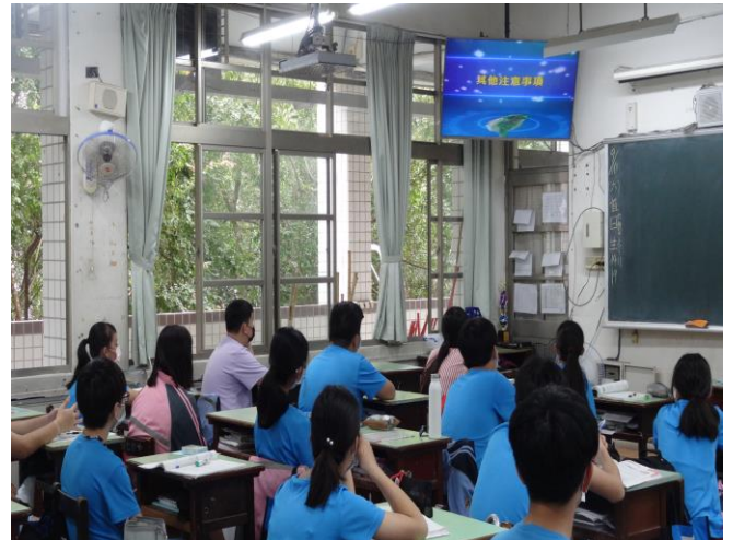
宣導地震避難知識