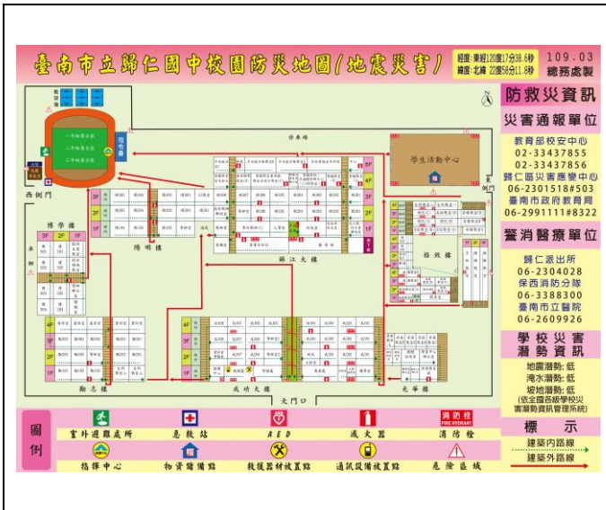
校園防災避難地圖