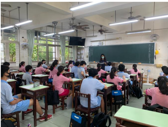
向學生宣導疏散路線