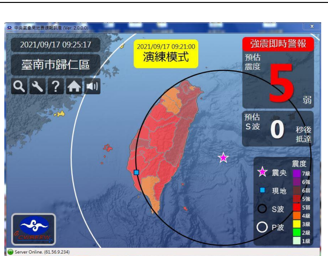
中央氣象局強震即時警報軟體