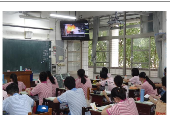
火災影片-遇到廚房火災萬萬不可這麼做