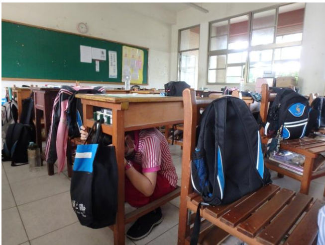
師生趴下、掩護、穩住