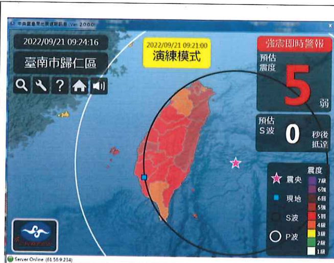
中央氣象局強震即時警報軟體