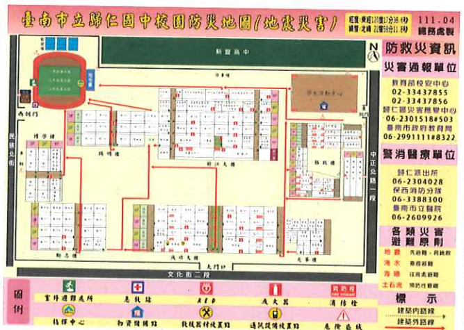
校園防災避難地圖