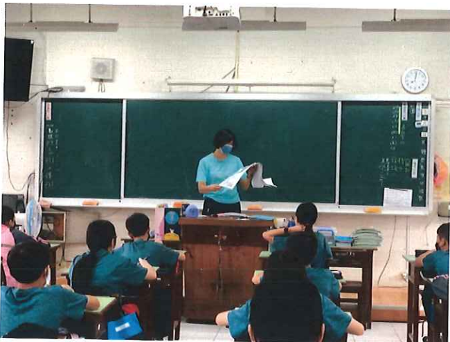
向學生宣導地震避難知識及疏散路線