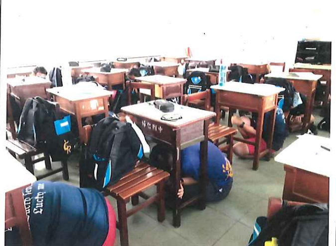
師生趴下、掩護、穩住