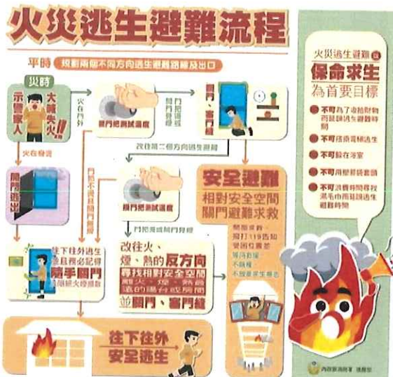
火災避難逃生宣導