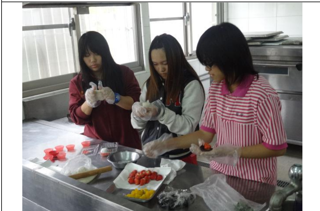
巧克力草莓麻糬製作(二)