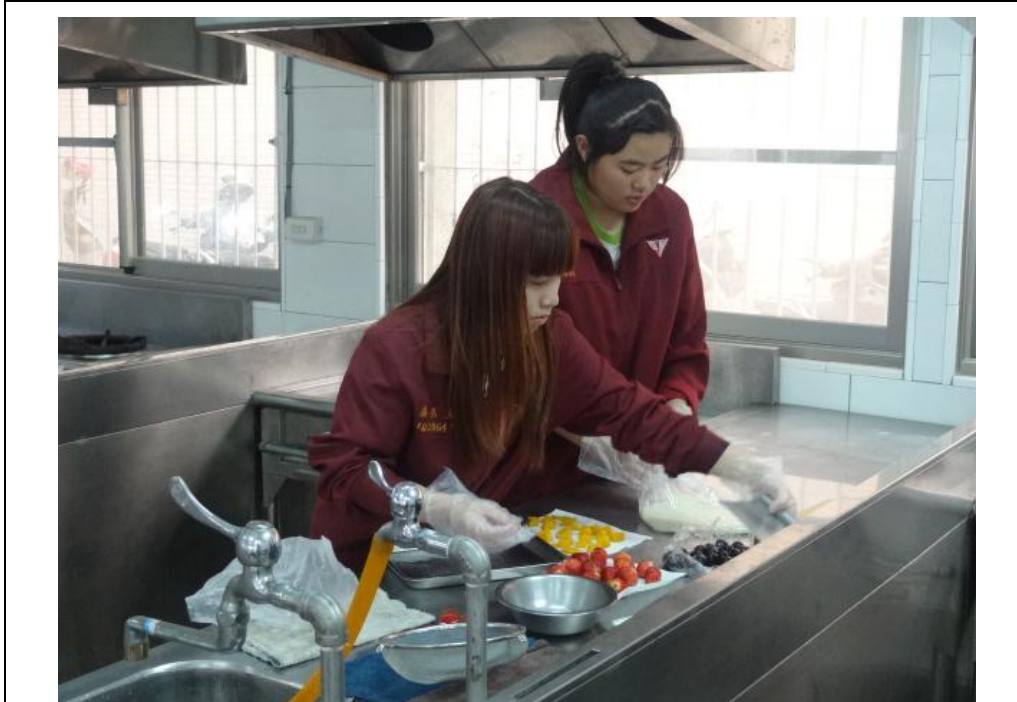
巧克力草莓麻糬製作(四)