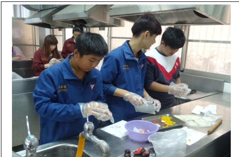
巧克力草莓麻糬製作(三)