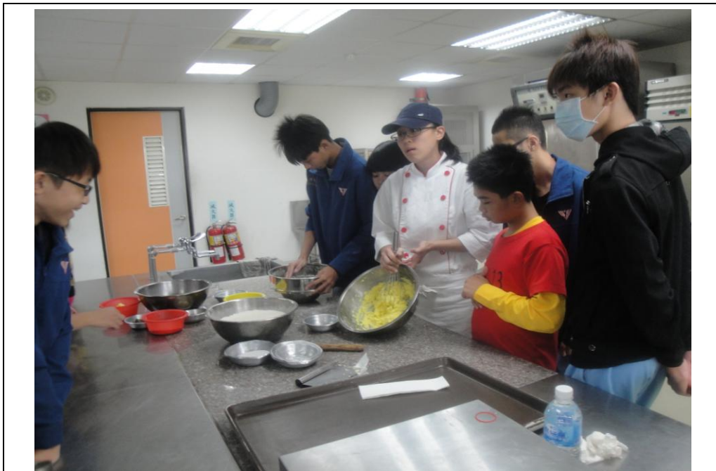
老師說明材料的攪伴程度