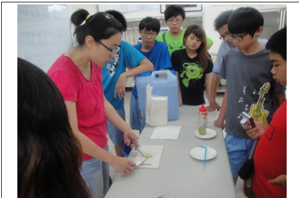
老師示範飲料調製的技巧