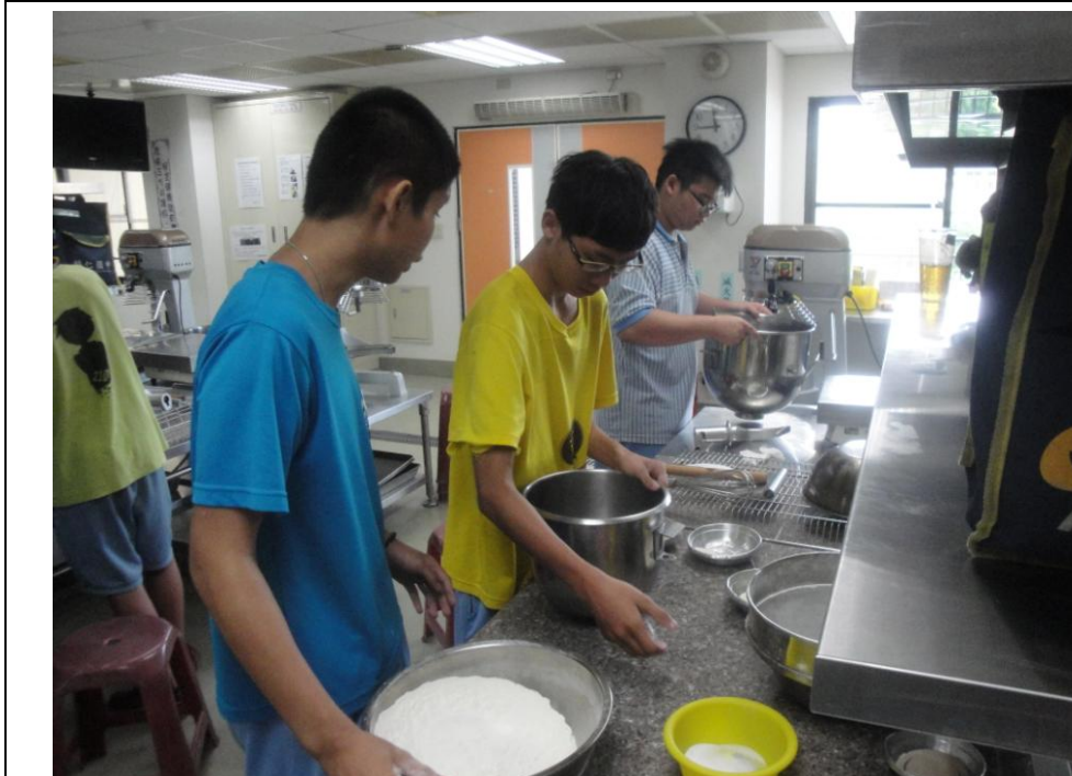
學生學習利用攪伴缸製作食材