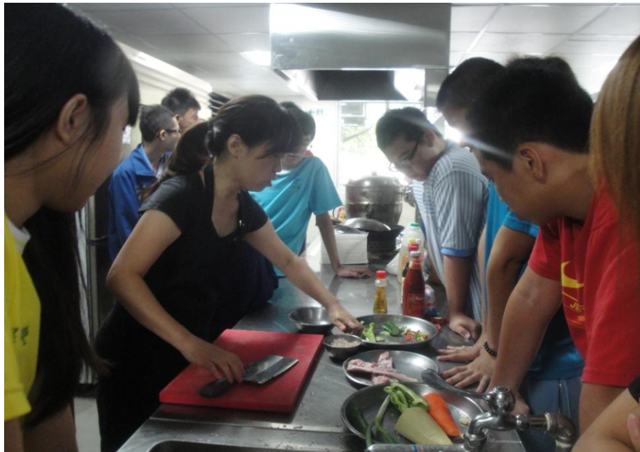
鏞萍主任示範廚藝技巧