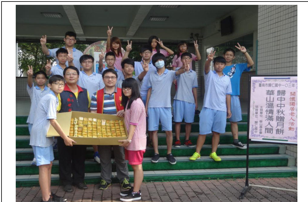
技藝專班學製作月餅贈送華山基金會