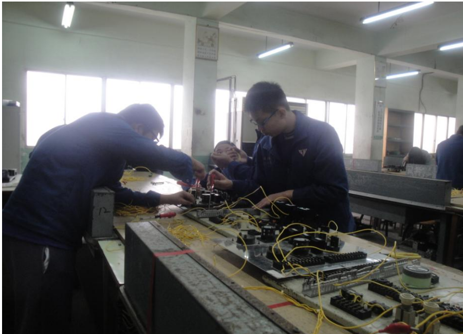
練習電路接線的技巧