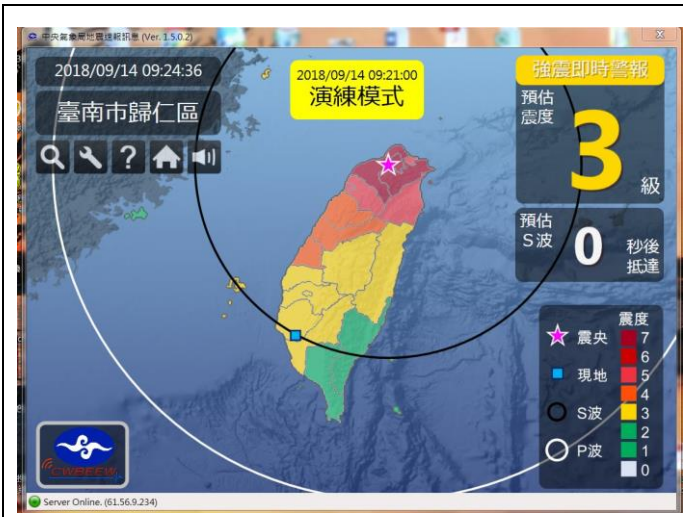
中央氣象局強震即時警報軟體