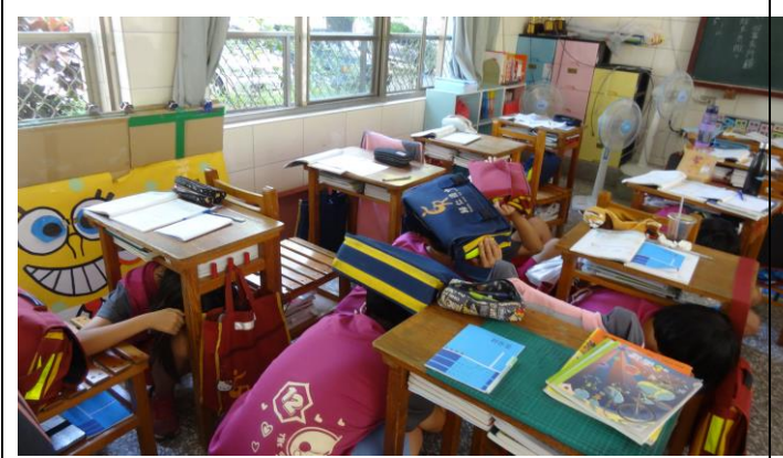
師生趴下、掩護、穩住