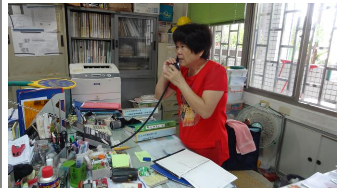
通報並啟動學校緊急應變組織