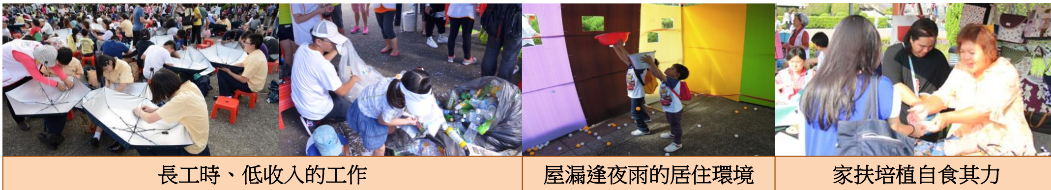
長工時、低收入的工作

弱勢孩子不僅面臨各種生活「貧」頸，更缺乏翻轉清貧的能力與自信！10月響應國際消除貧困日，《2018無窮世代~甘苦生活節》將以【甘苦展覽】【甘苦講座】【甘苦挑戰】三部曲，邀請民眾進一步認識弱勢家庭生活樣貌，感受他們難以對外訴說的「甘苦(台語kan-k 'o')」心聲！