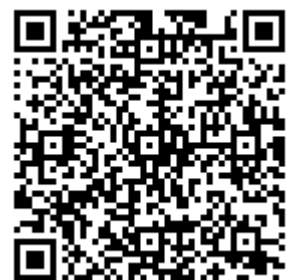
報名 QR 碼 ↑

聯絡電話:06-6226111 轉 760、769、763 敏惠醫專牙體技術科 王正鳳 、 薛亞銘 老師