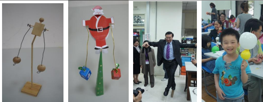
力學篇—力學達人實驗部分教具與活動照片