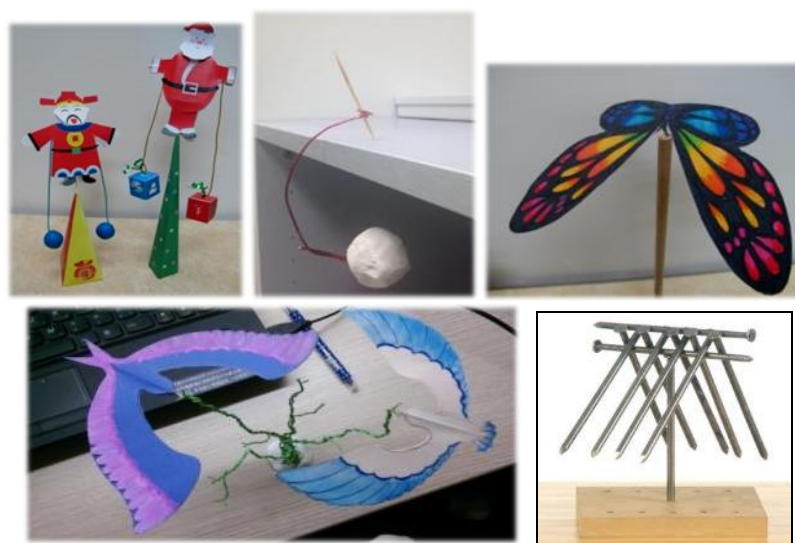
平衡實驗教具 DIY 的實作成品。