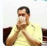
擤鼻涕、咳嗽 或打噴嚏後