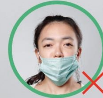
4 只遮住嘴巴，露出鼻子