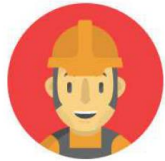
戶外工作者/運動員