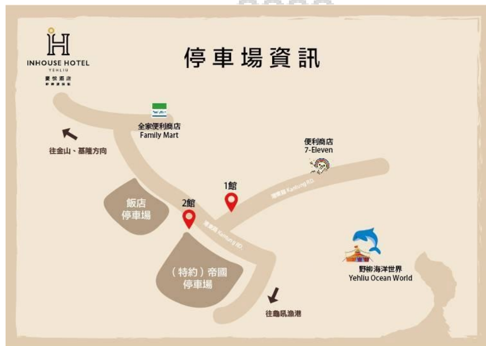
圖一。蔓悅酒店周邊停車