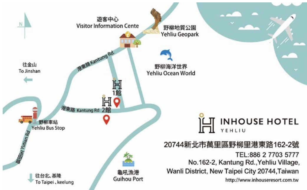
圖二。菱悅酒店周邊地圖