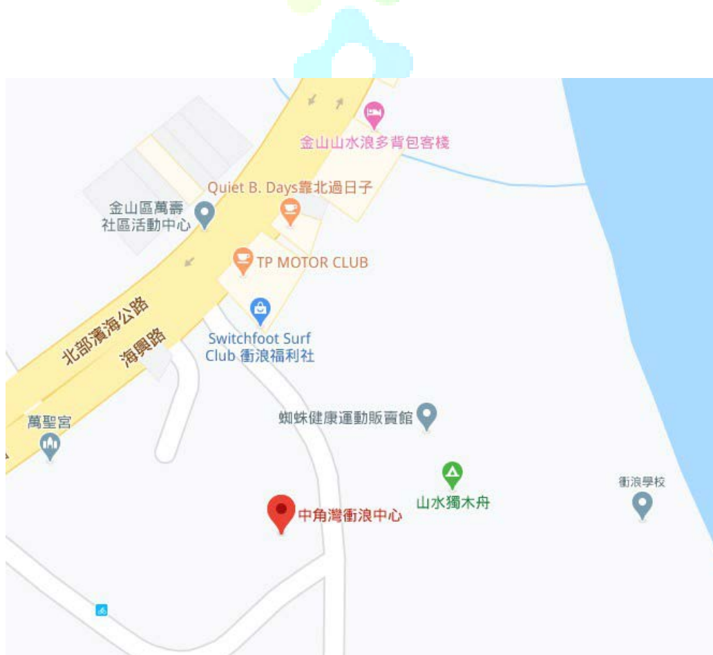
圖三。金山中角灣衝浪基地