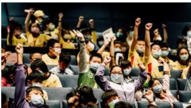
2020 臺中國家歌劇院「藝起進劇場—舞蹈篇」