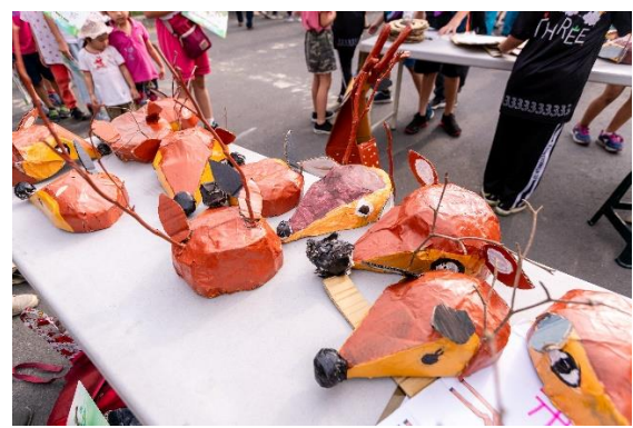
圖、2019 及 2020 年根與芽動物嘉年華各校攤位活動呈現