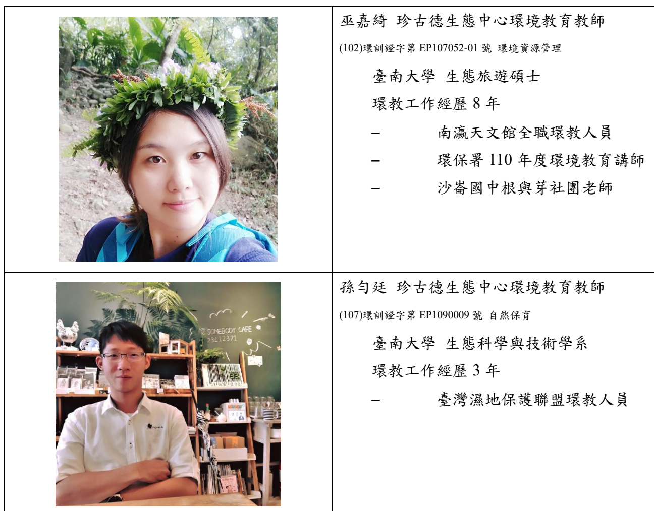
表、入校講師相關經歷