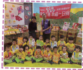
用愛預備每一份善