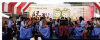
歸仁在地鄉團團聯聯演出