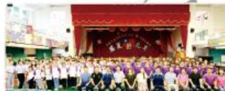
108年沂蒙青少年民樂團到本校交流參訪