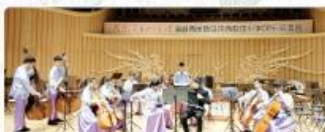
108年參訪山東臨沂進行中小學國樂交流演出