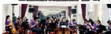
歸仁美學館「看電影、聽音樂」定期社區表演活動