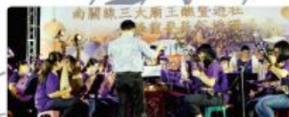
歸仁廟宇仁壽宮國樂團演出