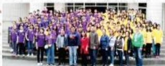
寒假期間到台北市立敦化國中進行國樂交流