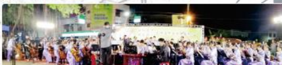
109年國樂團聯合成果展-仲夏享樂-仁壽宮廟戶外展演