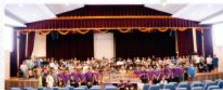
參訪金門縣金城國中並進行校際國樂交流