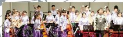
108年歸仁文化中心舉辦國樂成果展-觀樂-三十