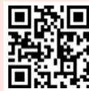
บันทึกผลการตรวจ

02 เข้าเว็บไซต์และดูผลการตรวจ (ไม่ต้องการเปิดเผยชื่อ) รับคู่มือแลกรางวัล และจับรางวัล