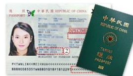
有效期限內護照正本