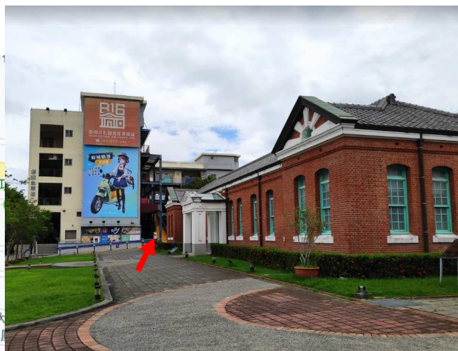
臺南火車站北側 箭頭為上課地點入口