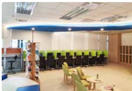
三樓影音視聽學習區