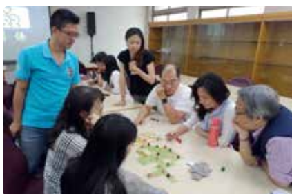
家庭教育工作坊 - 親子共遊研習