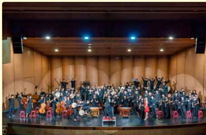
百年校慶國管樂隊聯合音樂會

營 造自主自律的人權校園，學生透過民主參與過程，普選成立班聯會、畢聯會等學生組織。本校學生社團多達五十個，涵括運動、音樂、藝術、語文各類，除辦理社團幹部研習，並輔導學生社團辦理各項動態靜態成果發表會，每學年校內外達數十場，提供學生多元展才場域。110 年南商百年校慶暨運動大會，於生活美學館舉辦的「國管樂隊聯合音樂會」更獲各界好評。國樂團於 106-112 年間數度代表台南市進入全國賽，獲得特優、優等；管樂團於 104-112 年間管樂合奏多次獲得台南市優等，打擊樂合奏、銅管五重奏代表台南市進全國，獲得優等，表現亮眼；各社團表演亦讓人印象深刻。