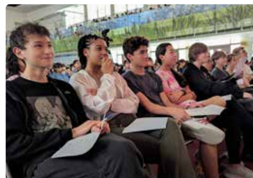
交換學生擔任英文歌唱比賽評審。

南 商為國外學生來台進行文化交流與技能學習的首選學校之一。交換學生有各自所屬的班級以融入群體生活，並由校方安排課表，跨科進行各領域探索。他們擁有較多自主學習時間，在校方排定的中文課之餘，用以發掘自己的興趣與專長。交換學生亦參加社團活動，無論在校園各場合，他們都是相當受師生歡迎的風雲人物。