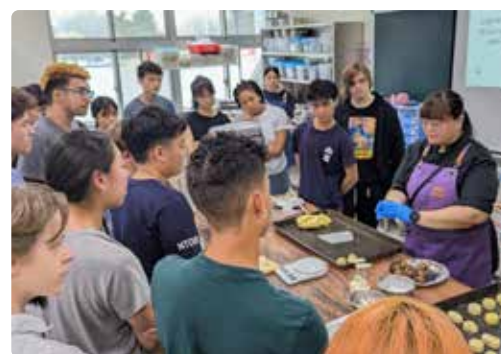
交換學生體驗觀光科專業課程，由教師帶領製作中式糕餅。