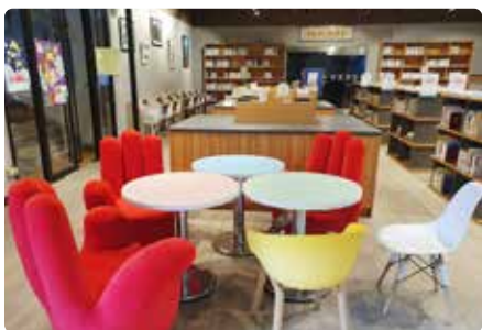
一樓閱讀休憩雅座

南商藝廊是南商重要的資產與場域，圖書館每年都有精采的藝文活動與展覽供師生觀賞與參與，這幾年與業師結合，舉辦肖像漫畫教學與展覽活動已成為本館年度特色亮點，同學在老師傾囊相授下，也漸漸打開了一扇美術的視窗。