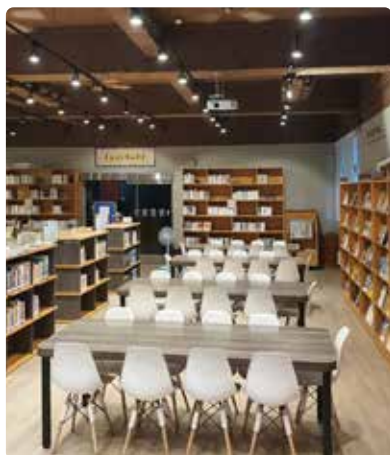
舒適的一樓閱讀講座區

圖書館除了豐富的藏書外，硬體設備與環境更是與時俱進。目前館藏共有紙本四萬五千餘冊、電子書千餘冊，固定期刊約三、四十種。