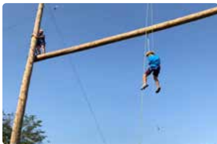
南商玩很大 - 探索教育活動

輔 導處統籌了學生輔導工作委員會、家庭教育推動小組。而在工作項目上包羅萬象，包括有：個別輔導、諮商與諮詢、小團體輔導與諮商、個案會議、心理師諮商諮詢服務、生涯輔導、升學輔導、教師研習、家庭教育、性別平等教育、轉銜輔導及服務、認輔制度、心理測驗、輔導股長、輔導義工、多項國教署補助專案計畫經費申請；以及危機事件的處理與協助，優質化計畫各類師生活動。透過多元豐富的輔導活動規畫推動，並與教師、家長、行政人員等攜手合作，同時引入校外專業資源，共同維護學生福祉，陪伴學生度過最多變、又美好的青春年華。