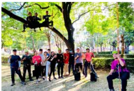
戶外教育攀樹體驗營