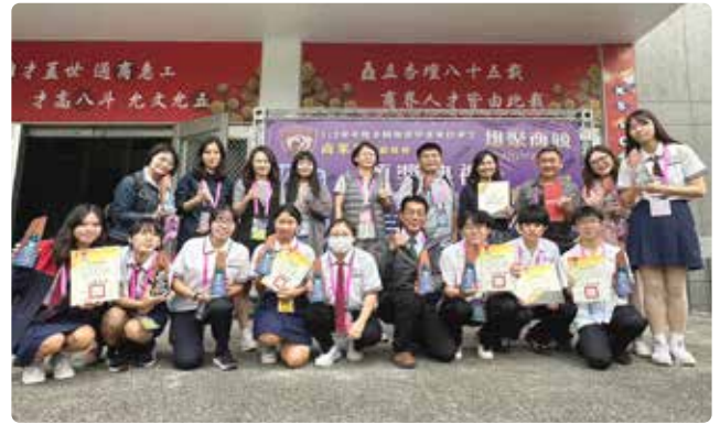
▲ 112 學年度南商選手榮獲兩座金手獎、六座優勝，成績全國第一