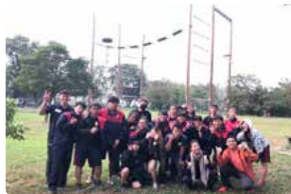
南商玩很大 - 探索教育活動