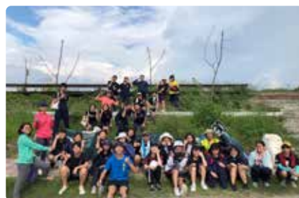
漁光島淨灘體驗活動