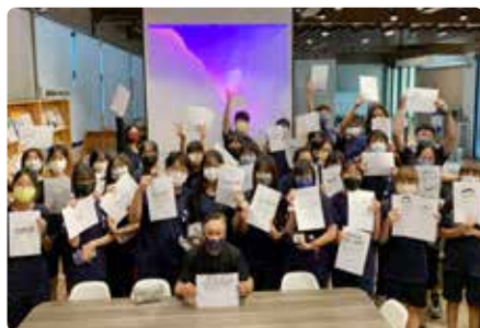
請業師前來舉辦小型研習