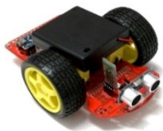
<小阿丟輪型機器人>