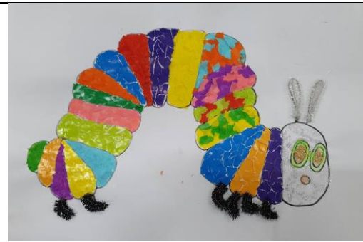
七彩繽紛的毛毛蟲