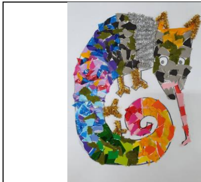
拼拼湊湊的變色龍